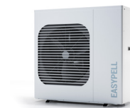
Pompe à chaleur