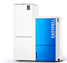
Chaudière à granulés